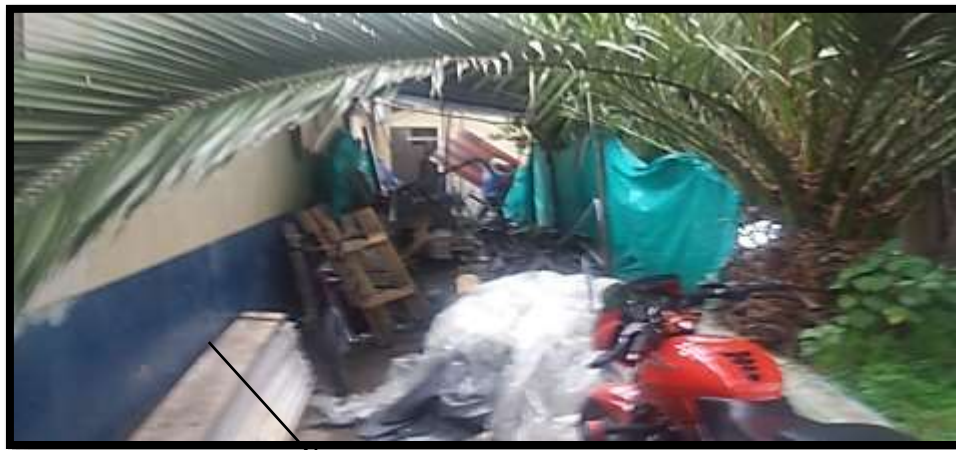
Láminas de PVC de cielo raso a la intemperie.

Del análisis del expediente se determinó que la SED, tenía conocimiento de que la intervención del cielo raso no era una obra que obedeciera a los principios de eficacia, eficiencia y oportunidad para superar el estado de deterioro en que se encontraba “La Casona “ del Colegio Integrado de Fontibón; en efecto, a tenor del informe de supervisión de fecha 22 de Febrero de 2016 el alcance de la intervención en el Integrado de Fontibón sede A se definió en recorridos realizados los días 28 y 29 de Septiembre de 2015 en donde se proyectó como necesario el cambio de la estructura y cubierta de la zona de la Casona, en los siguientes términos: