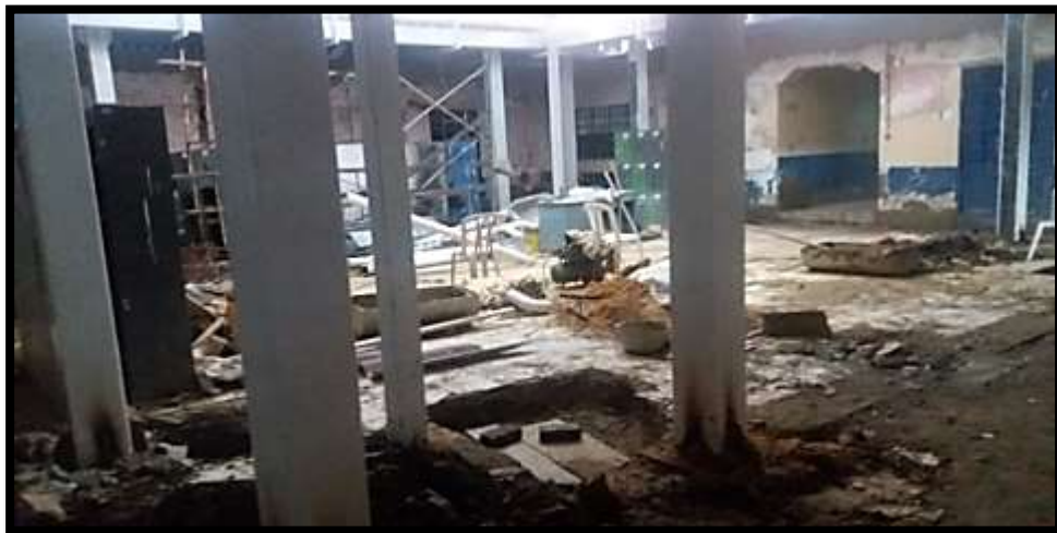
Vista interior Casona Colegio Integrado de Fontibón Sede A. Visita de 25 de noviembre de 2016.